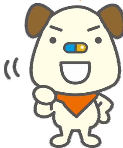
図:くすりができるまで